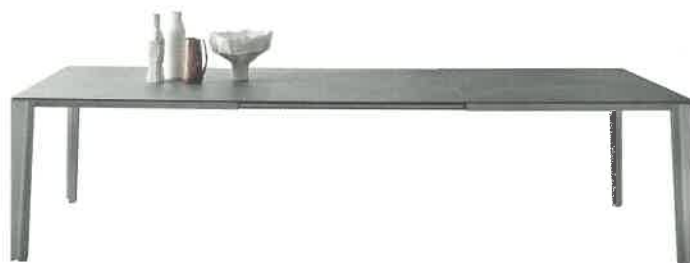
2015 Skin DESALTO