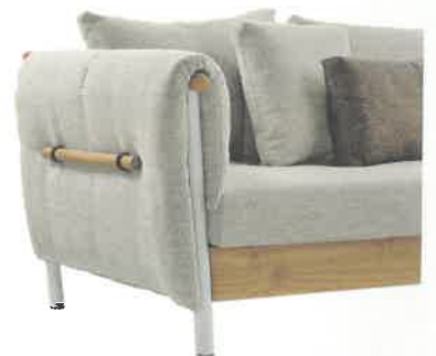
2017 Domino TALENTI