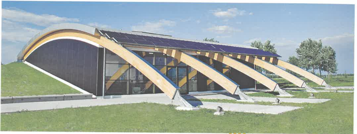
2012 Polins - Polo per l'Innovazione Strategica, Portogruaro (VE)