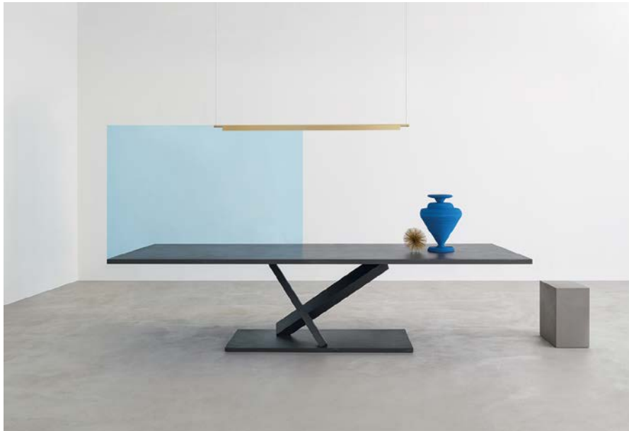
↑ Dessinée par Tokujin Yoshioka en 2013, avec son unique support central, la table Element fait appel à une ingénierie complexe.